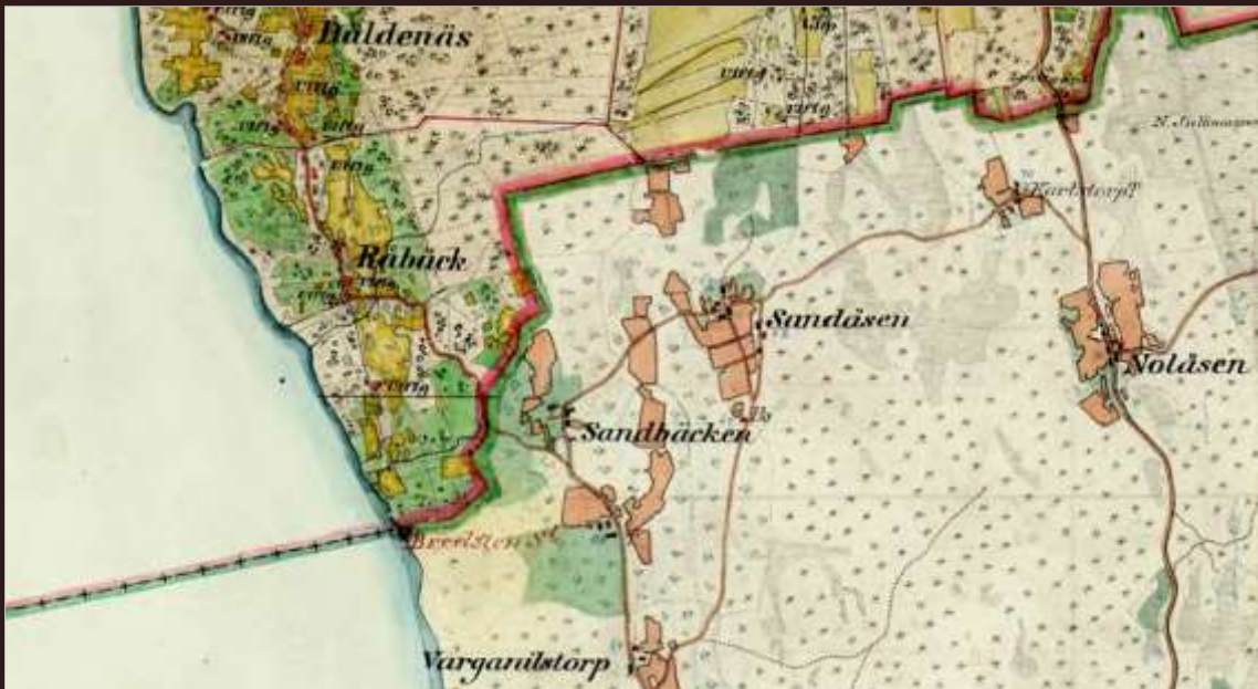
Häradsekonomiska kartor [omkring år 1990].