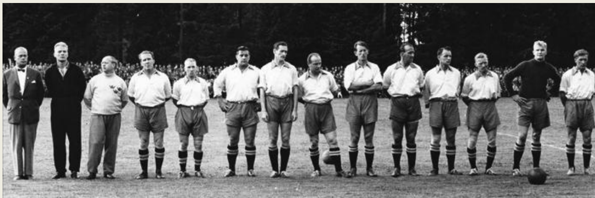
På rad: De olympiska mästarna i fotboll 1948.

Alla trodde att den svenska truppen skulle göra bra ifrån sig under sommarens OS och den tron besannades. Det vet vi med facit i hand.