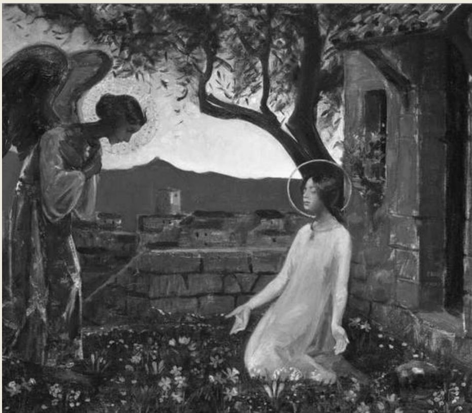
Jungfru Marie bebådelse.