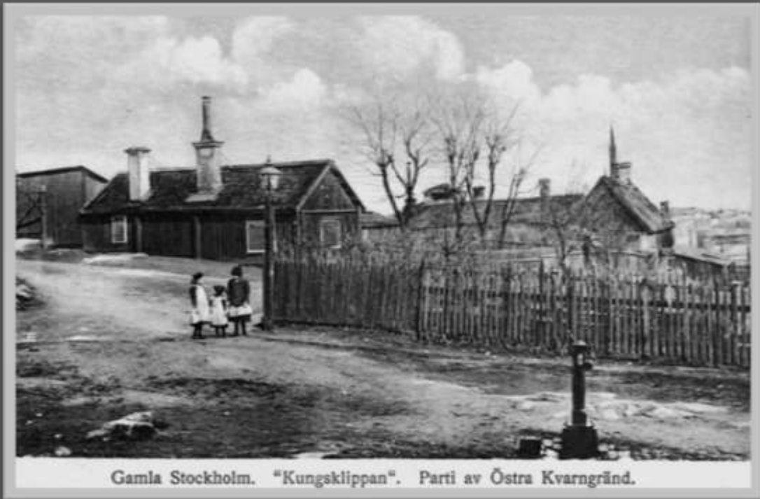
Gamla Stockholm. "Kungsklippan". Parti av Östra Kvarngränd.