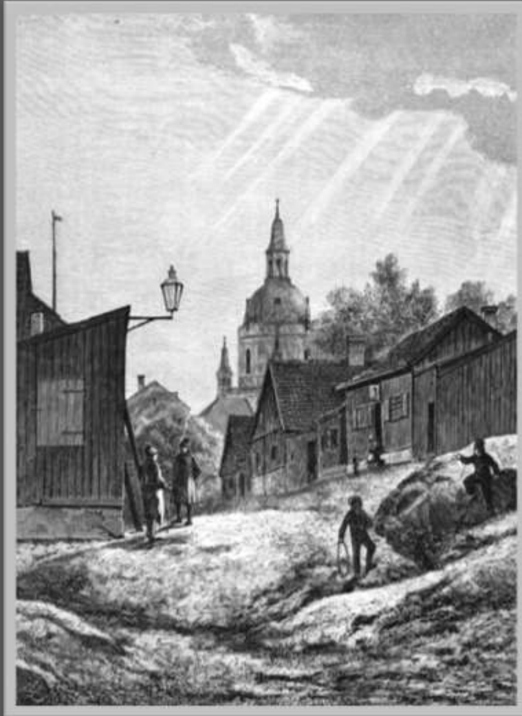
Okänd Konstnär.

Här är en bild från Katarina Östra Kvarngata (nuvarande Stigbergsgatan) 1870: