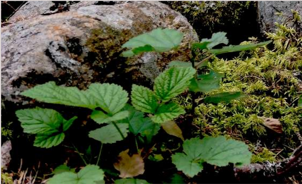
Stenmur (ej gränsskiljande) i Barrud (2019-09-24).

Barrud har bebotts och brukats i drygt 450 år. Några viktiga årtal på vägen till nutiden, det moderna tjugoförsta århundradet: