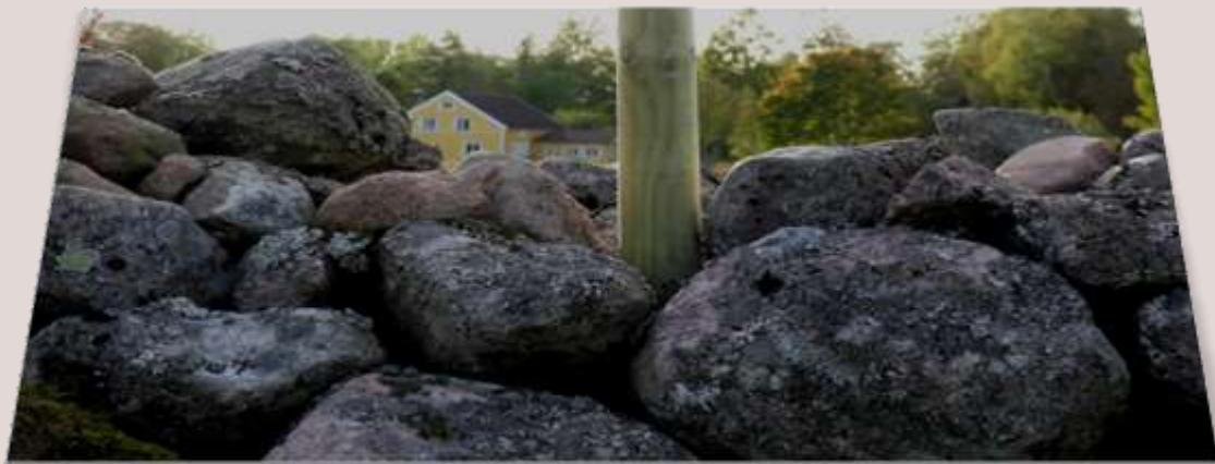
Stenmur (gränsskiljande) i Barrud (2019-09-24).