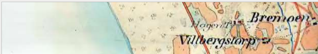
Hagen. Torp under Laxå Bruk.