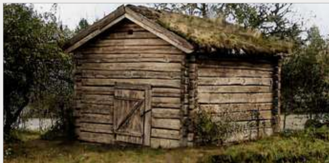
Torvtäcktbod, söder om Ramsnäs, står det i bildtexten