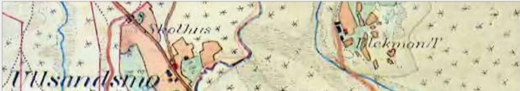
Bläckmon. Torp under Laxå Bruk.