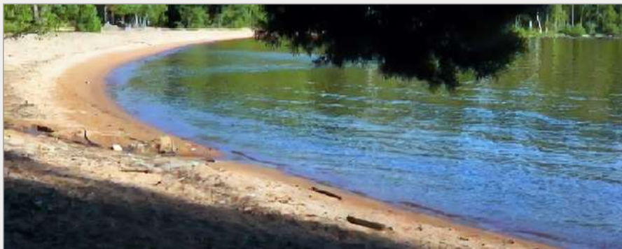
På väg till - och vid – Brevikens badstrand 1 september 2020.