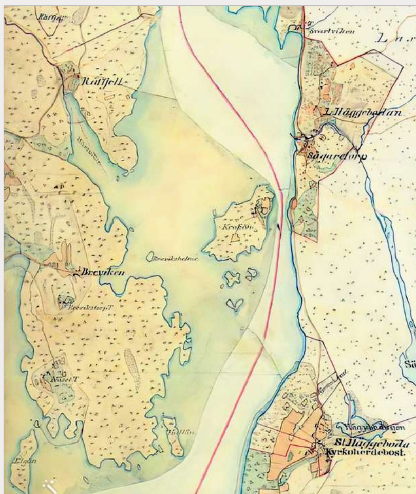
Från kartbladen Barrud och Åboholm.

De här kartorna kommer att användas även i denna del – nu i originalfärg - eftersom vi närmar oss den tid (omkring år 1880), då kartorna ritades.