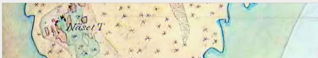
Näset. Torp till Laxå Bruk,