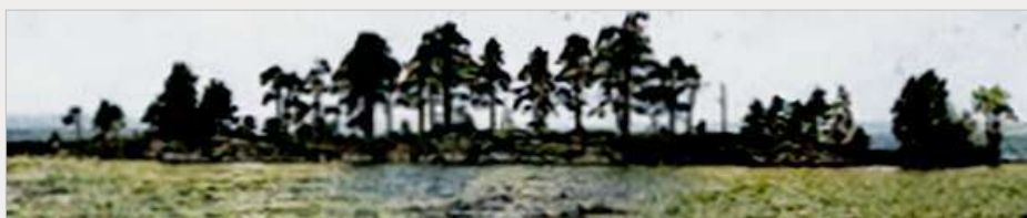
Den som minns (från del ett) vad den här holmen heter, får en guldstjärna.

En annan sak: Jag använder Husbonde och Husfru , oavsett om det gäller hemmansägare eller torpare, Gullhögen var ett torp.