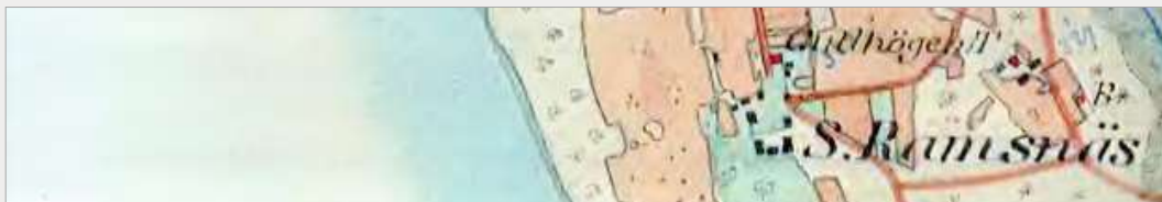
Torpet Gullhögen, nästgårds till ramsnäs.