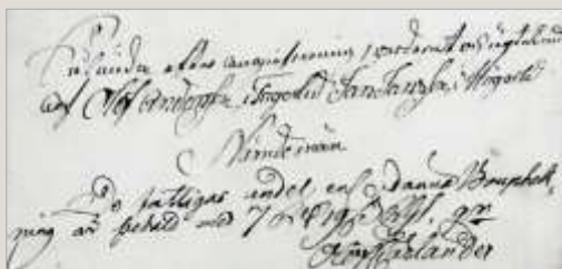
Från dokumentets sista sida.