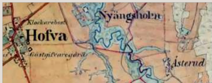
Åsterud på den häradsökonomiska kartan i framtiden (omkring 1880).