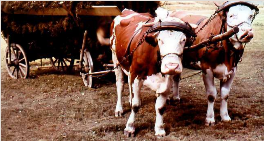
Oxspann, dock inte från Åsebol.

Vidare i djurbesättningen (högra spalten där uppe): En liten tjur och en stut ( kastrerad tjur, som vid tre års ålder blev en ox ). Man hade trettio får och tjugotvå getter, en vit sugga och ytterligare tre grisar och slutligen, sex bikupor.