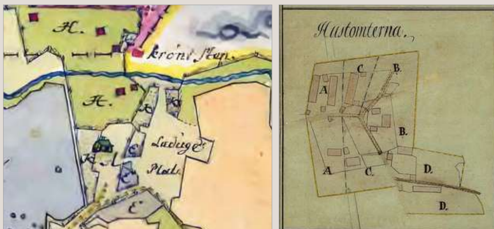
T v: 1747 års karta. T h: Karta från storskiftet 1810.