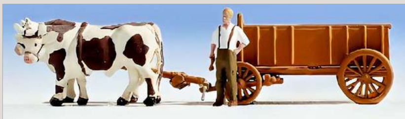
Ej heller från Åsebol.