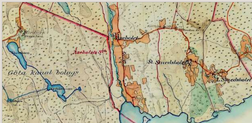
Åsebol – i en annan skala – men vid samma tid (omkring 1880).