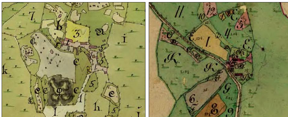
Högshults centrala delar 1781 och dito Mobäckens 1788.