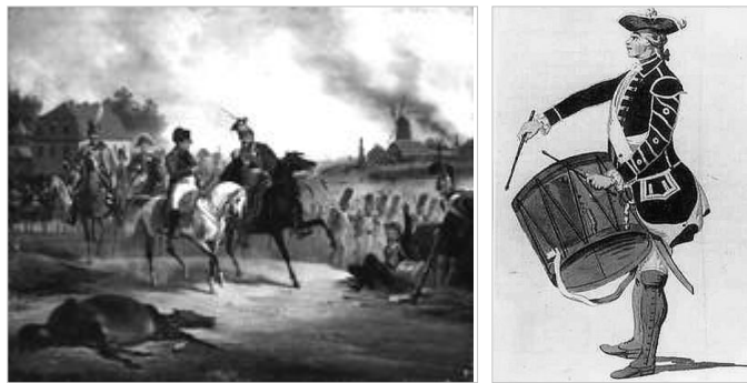
T v: Napoleon och Poniatowski vid Leipzig (målning av Suchodolski).