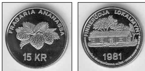
Finnerödja hembygdsförenings lokalmynt från 1981.

Fragaria ananassa är det latinska namnet på den korsning av olika smultron som kallas jordgubbe på svenska. Smultron fanns förstås redan på Linnés tid – och mycket, mycket tidigare – och han klassade smultronen som rosor. Jordgubben är alltså en rosväxt, där blomaxeln nertill är som en skiva, vilken upptill har en käglas form. Efter blomningen sväller denna kägla upp och blir saftig och söt och välsmakande. Detta gäller smultron och egenskaperna är desamma för jordgubben, med skillnaden att jordgubben är avsevärt större än smultronet och i olika grader mindre söt. Själva frukterna, de gulaktiga prickarna på jordgubbarna, är nötter.