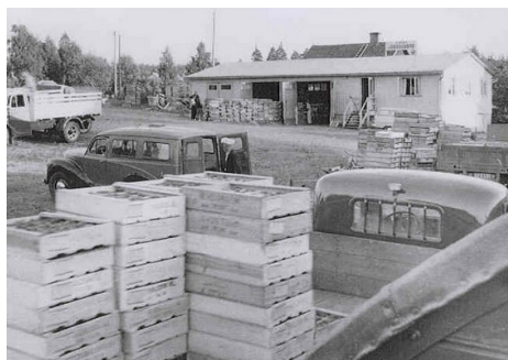
Firma Jordgubbar (1955)

Jordgubbsodlareförening ett faktum. Denna ekonomiska förening verkade sedan under hela jordgubbsepoken vid sidan av en ungefär lika stor konkurrent, det privatägda Firma Jordgubbar. Jag har ingen som helst uppfattning om de båda företagens respektive styrka och inte heller om det var ekonomiskt fördelaktigt att leverera till det ena eller andra företaget. I vilket fall som helst skickade dessa båda jordgubbsgrossister iväg en hiskelig massa jordgubbar från Finnerödja, år efter år och det var den verkställande chefen för Firma Jordgubbar som varje sommar fick äran att kora årets Miss Jordgubbe, om det nu kunde betyda något i sammanhanget. Möjligen biträdde ordföranden i Jordgubbsodlareföreningen och vi återkommer till Miss Jordgubbe. Fattas bara!