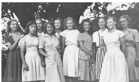
Jordgubbsflickorna i Kavelbron (1947)

Jag undrar om de visste vad de gett sig in på, de studerande stadsflickorna som kom till Finnerödja på 1940- och 50- talet. For de hem till sin gamla vana bekvämlighet och förbannade lägerlivets alla besvär eller hade de med sig värdefulla erfarenheter och minnen i bagaget? Vet ej, men troligen både och. Det första lägret på vår trakt anordnades år 1947.