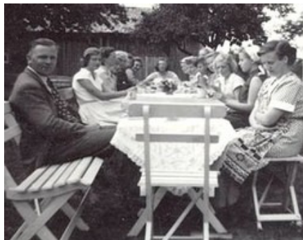
Rosendalen, hos familjen Vörde. Måltid (1950- talet).

flaskorna kostade! Hemfärden gick bra som vanligt och även den här resan hade säkert gått med vinst, trots excesserna i staden.