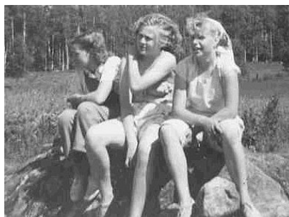
Tre jordgubbsflickor i Vallsjöbol, år 1949.

Det var viktigt att skydda de ömtåliga, nyplockade bären från sol och regn. Tillfälliga byggnadsverk av störar och bräder, med en presenning som tak, spikades upp och de här tälten var också den naturliga samlingsplatsen för arbetslaget. Där hade var och en sin stapel lådor, där förvarades tomlådor och kartonger och där förtärdes ett och annat mellanmål. Man stoppade ett tiotal hopvikta kartonger i bakfickan, tog med sig en tomlåda och gick bokstavligt på knäna tills kartongerna var fyllda. När arbetet började var startfältet väl samlat. Det kunde vara så där en åtta, tio banor, d v s rader, med lika många tävlande i bredd och så klara, färdiga, gå – och ett maratonlopp hade börjat. Men det gjorde ont att plocka jordgubbar. Det utvecklades många olika stilar: Plockare som gick med kutad rygg, plockare som kröp på ett knä, plockare som kröp på båda knäna och plockare som hasade sig fram liggande, med en armbåge i halmen samt ett antal andra, mindre stilrena varianter. Under ett dagsverke kunde samma plockare utveckla samtliga stilar, allt eftersom utsatta kroppsdelar tog stryk. Plötsligt blev det åskväder och då gällde det att snabbt som ögat lämna fältet och samla ihop kartongerna och få dem under tak. Ibland var det dagsregn och då måste regnkappan sitta på, från tidiga morgonen till sena eftermiddagen. Jordgubbarna i sig själva innehåller väldigt mycket vatten och ytterligare tillskott av väta var synnerligen förödande för kartongerna och bären.