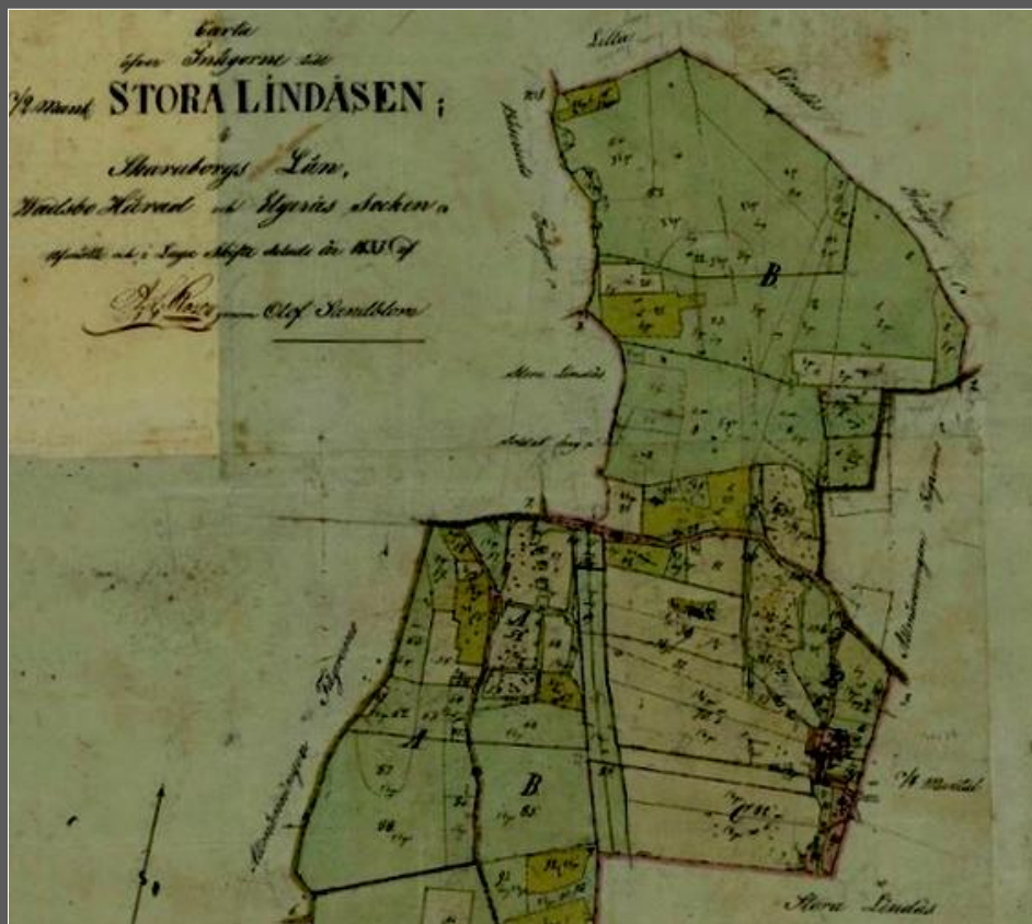
Stora Lindåsen. Laga skifte 1833. Norra delen av hemmanet.