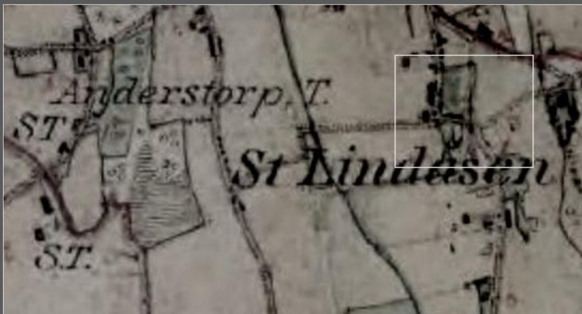
Häradsekonomska karta från c: a 1880. Ungefär samma område som laga skifteskartan.