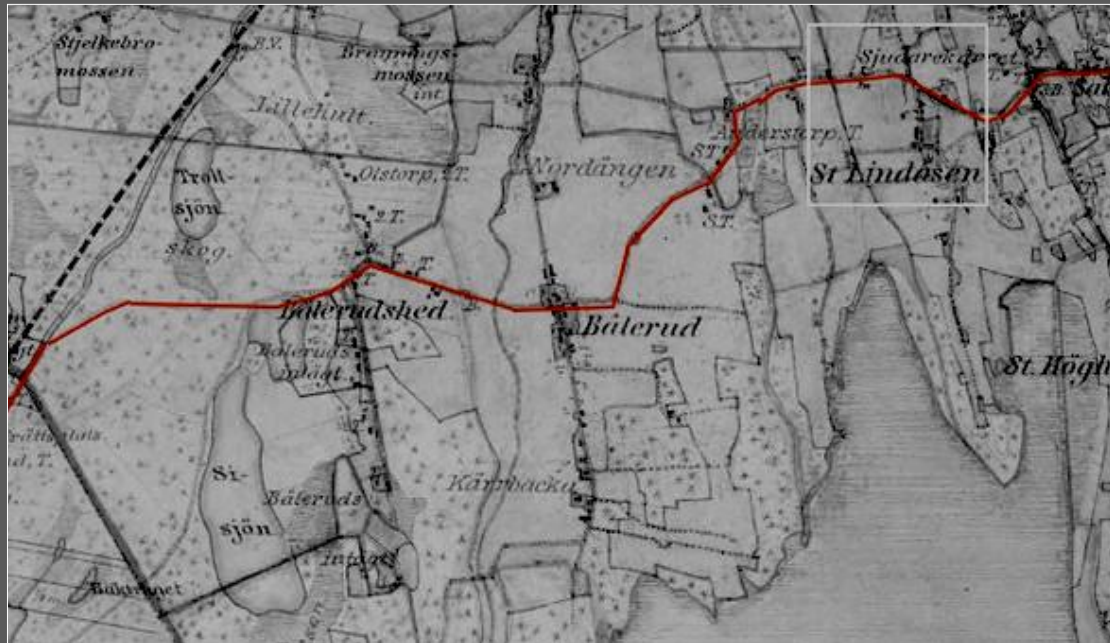
Häradsekonomisk karta från omkring år 1880.

När man åker från Töreboda, över Slätte, tar av till höger mot Lindåsen och passerat Bålerudshed, Bålerud samt Anderstorp, kommer man till Stora Lindåsen. Nu för tiden ligger den här vägsträckan i Töreboda kommun. Hade man åkt samma väg förr i tiden, var det i Älgarås socken man färdades.