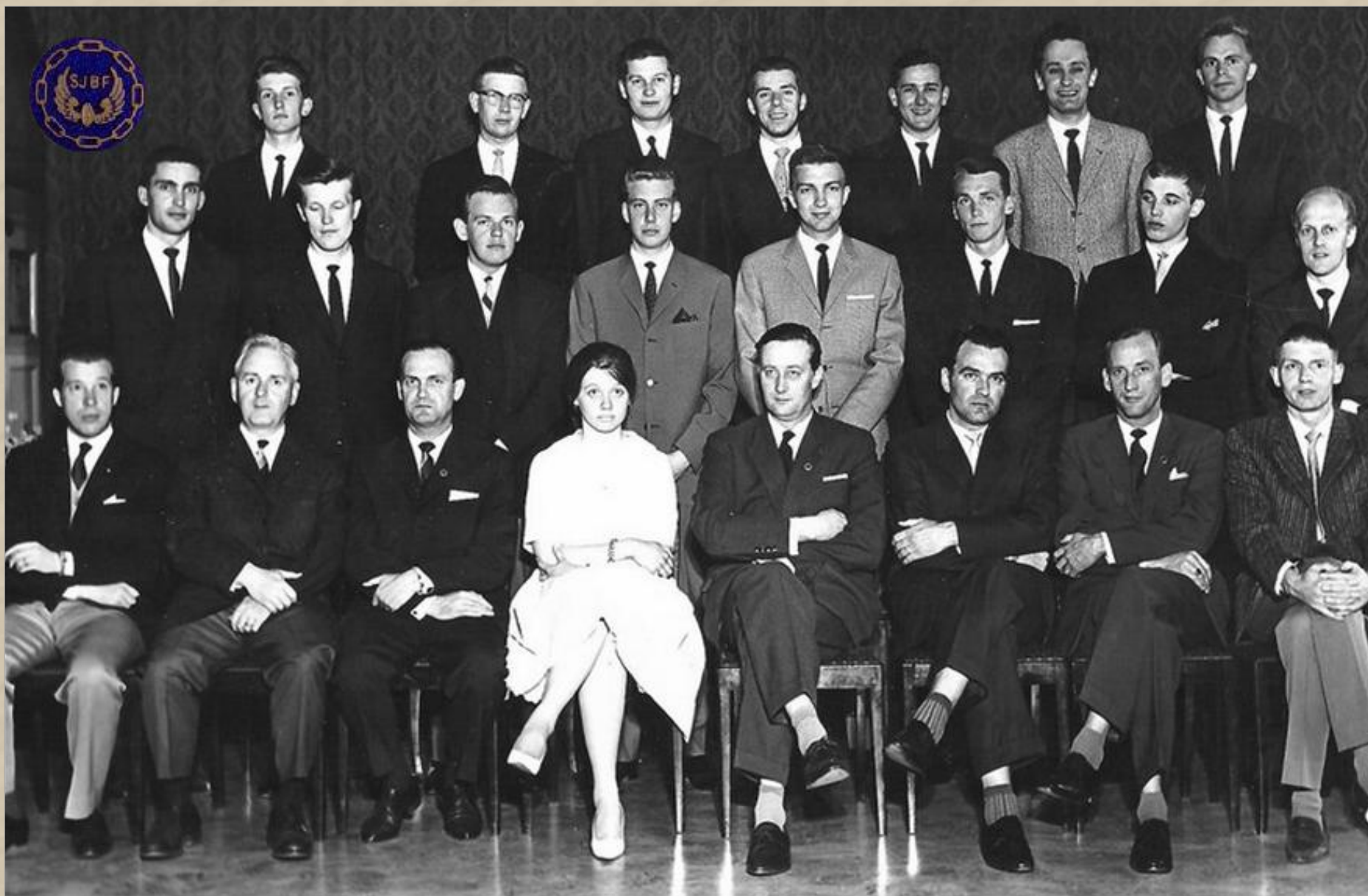
1961 i Stockholm. Trafikelever hos det fackliga SJB (Statens Järnvägars Befälsförbund) som tillhörde SR, senare SACO, som SJTF.