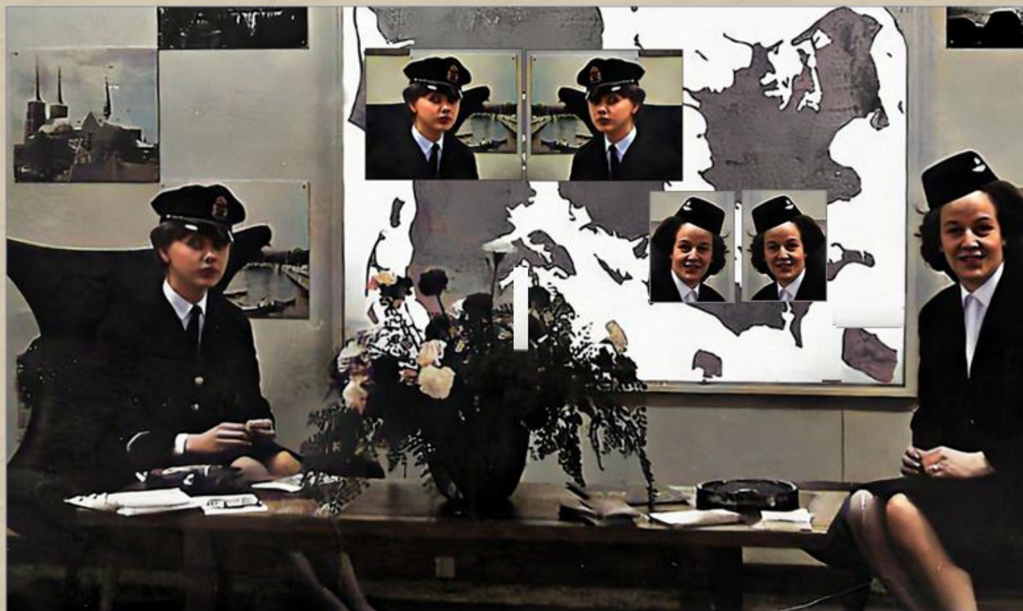
SJ och DSB, utställning i Stockholm på 1960 – talet.