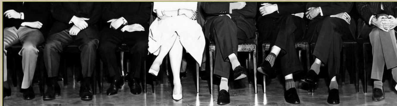
Fotnot: fot - foto.