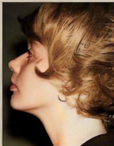
Uppre: 1963 (i en fotoautomat i väntsalen, Stockholm C. Nere: Vallingatan, Stockholm 1961