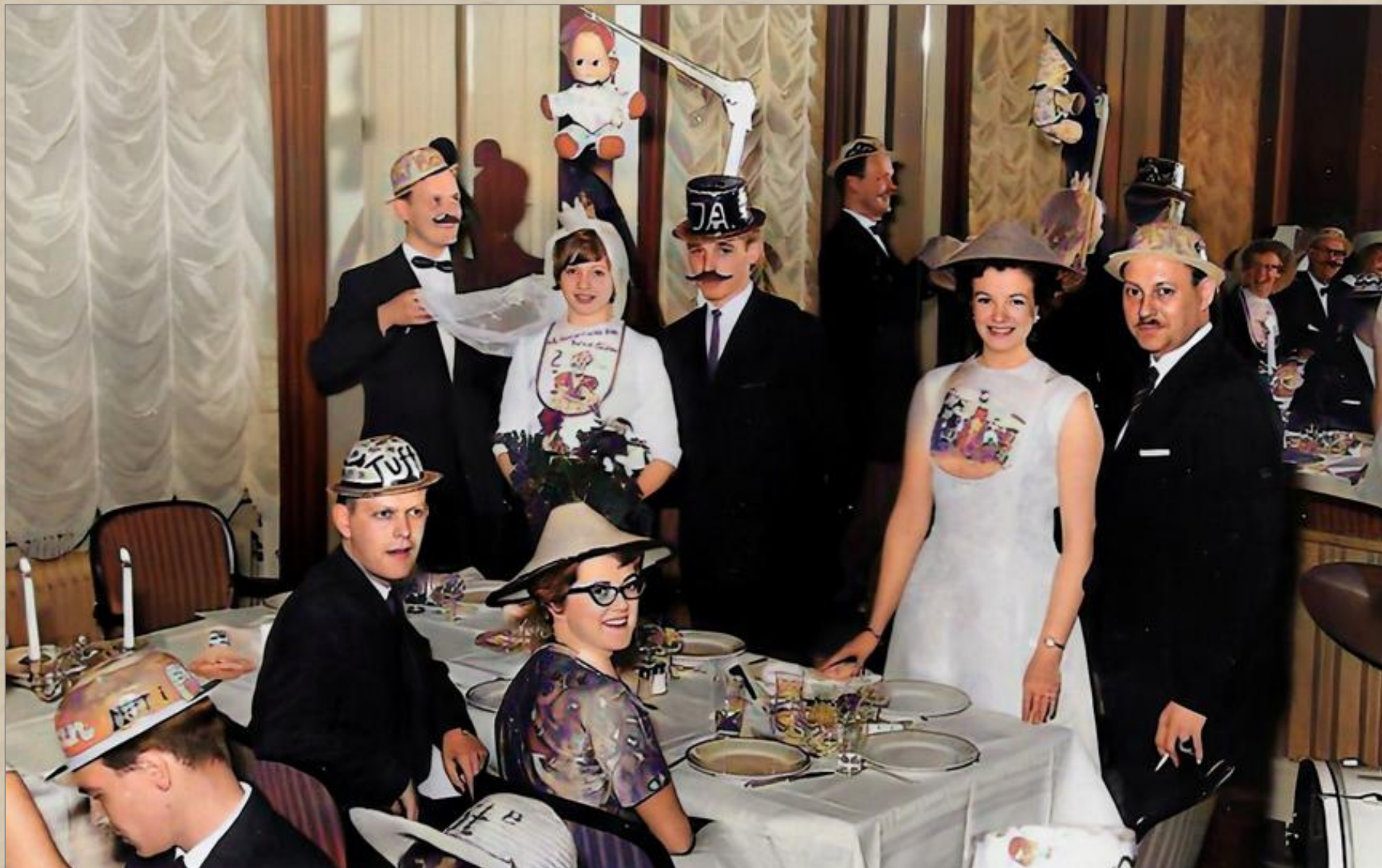
Uppvaktade vid ett avdelningsmöte med SJBf. Malmö år 1962.