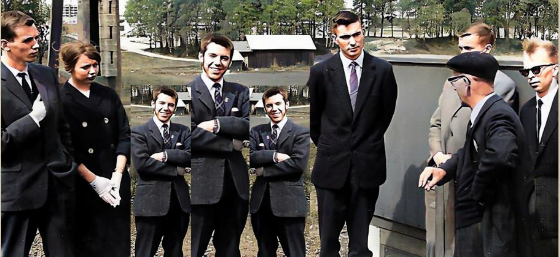
Någonstans i Sverige 1961: Mer eller mindre (t v) kunskapshungriga SJ- elever.