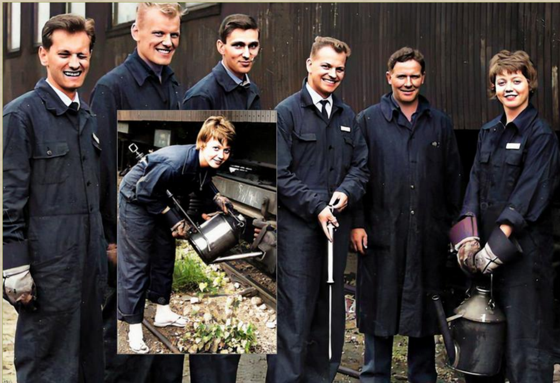
År 1961: Intet var SJ främmande att lära järnvägsanalfabetiska trafik elever. Här var det vagn - tjänst i Ängelholm. (Jag gjorde samma resa en vecka senare)