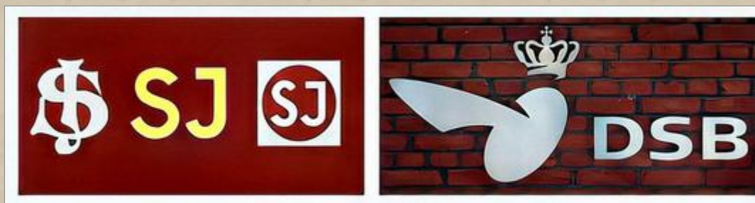
Logotyper SJ och DSB.